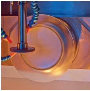
Verarbeitung von Durchmessern bis zu 500 mm