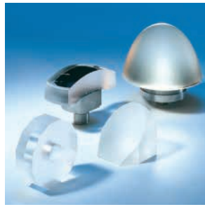
Vielfältige Anwendungen: Sphären, Asphären, Planoptiken und Prismen