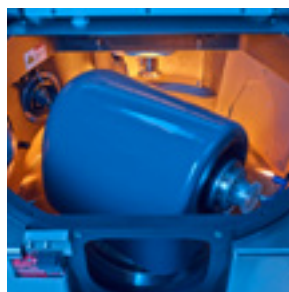
Alinhamento orbital das ferramentas com spindle da lente robusto.