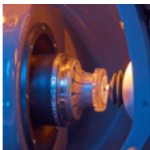
Calibração de ferramenta integrada.