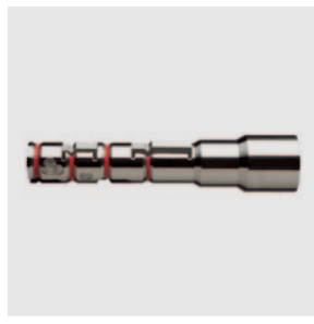
多功能刀具灵活地提供了特殊尖边的加工。