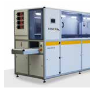
Vollständig automatisiertes Ultraschallreinigungssystem Hydra-sonic-40