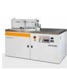
Kompaktes „Plug & wash“-System Hydra-sonic-10