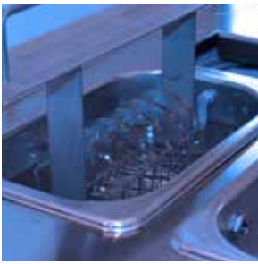
Hydra-sonic-5 semi-automated cleaning and drying process