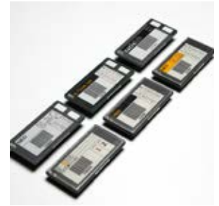
四色显示:黑色、白色、红色和黄色。车房可根据特定的需求配置颜色。