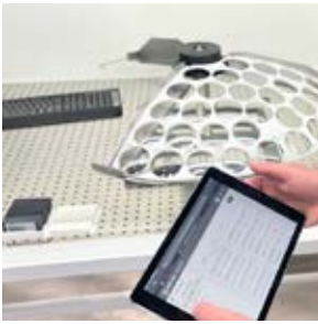
数字化形式的可视工单信息