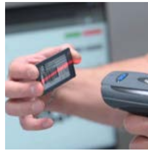
手动模式可以应用于任何车房区域,如仓库、镀膜车间或物流部门。