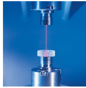
精准快速: 激光校准系统