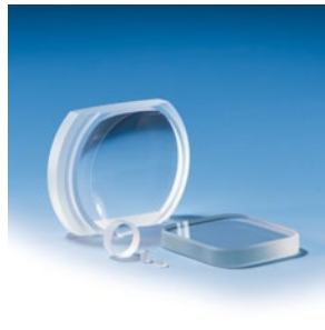
可加工各种几何形状的镜片, 包括非圆形的镜片