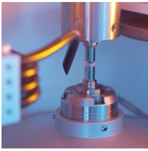
直径1-50毫米的高精度定心磨边