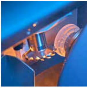
快速粗磨加工, 转速达每分钟35,000转, 不到10秒时间即可切割、倒角和粗磨