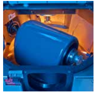
刀具轴与坚固的工件主轴(B轴)轨道排列。