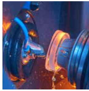
通过刀具冷却功能冷却刀具的切割点。