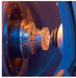
集成的全自动轴和刀具校准