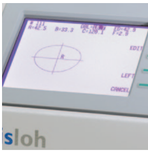
O monitor integrado permite ver a forma traçada