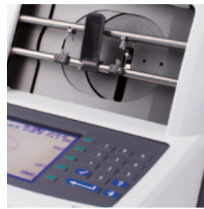
O teclado integrado compacto permite ao operador inserir dados do serviço diretamente na traçadora.