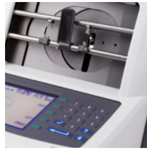
内置紧凑型键盘, 使操作员可输入数据