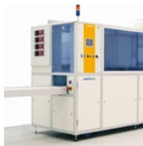
Sistema automatizado para remover lentes Hydra-sonic-10