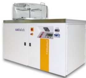
Sistema compacto "listo para lavar" Hydra-sonic-10