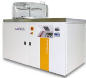
Kompaktes „Plug & wash“-System Hydra-sonic-10