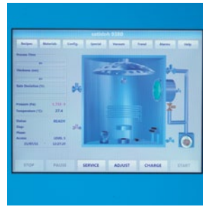
易于使用的触摸屏