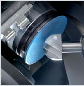
V-35的32毫米PCD刀具可以高速加工所有有机材料。