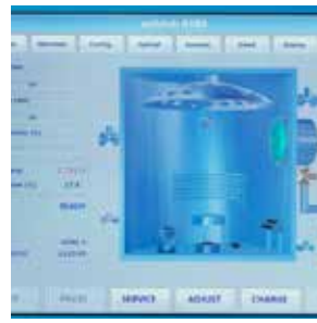
界面友好的人机交互软件