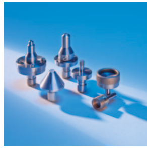
Werkzeuge für Fertigung, Polieren und Abrichten