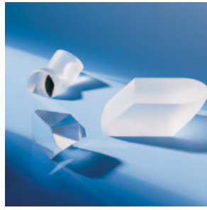
可加工不同形状的棱镜