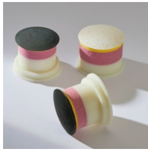
智能抛光头嵌入RFID电子标签