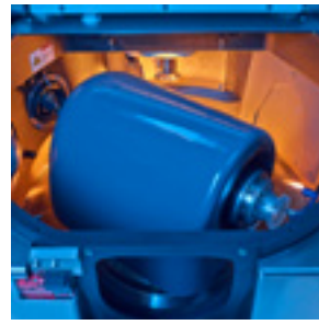
刀具轴与坚固的工件主轴(B轴)轨道排列。