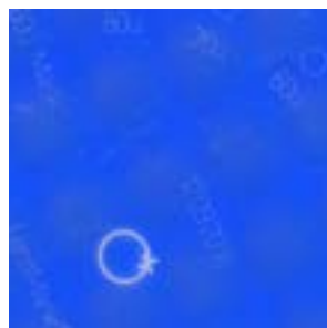
Variações de intensidade da gravação.