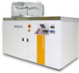
Hydra-sonic-10便利的“即插即洗”系统